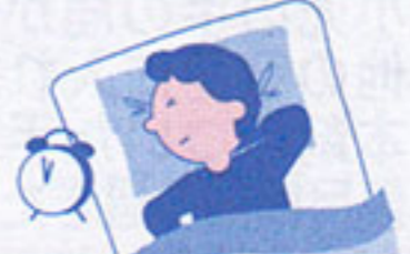
体が暖まるとかゆい! (→裏面に続きます。)