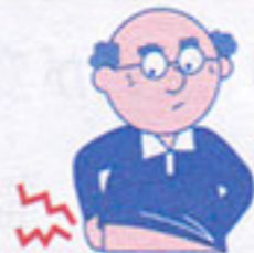
老人の乾燥性皮膚