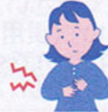
成人の乾燥性皮膚