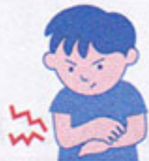
小児の乾燥性皮膚