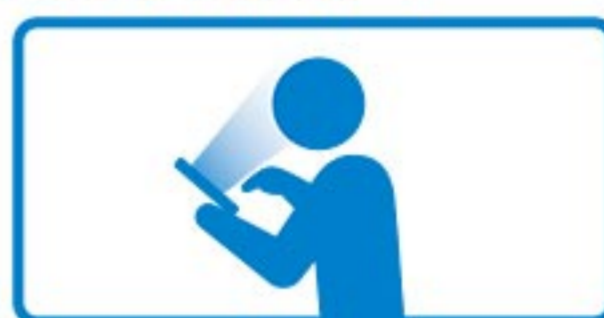
SNSや動画サイトなどの スマホ凝視