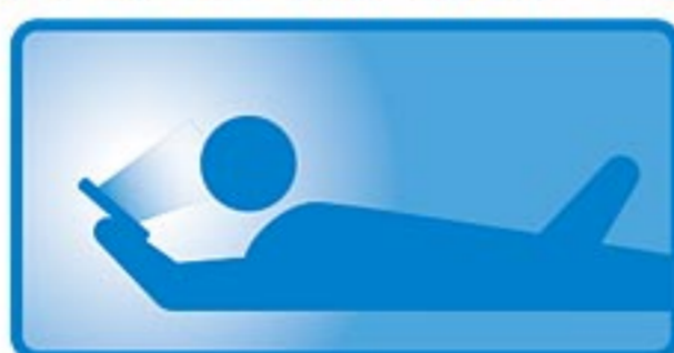
真っ暗闇の 部屋での寝スマホ