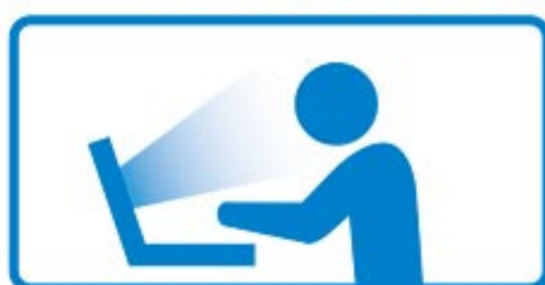
長時間のパソコン作業

ついつい、長時間コンタクトをつけたまま こんなことをして、目が疲れていませんか？