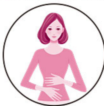
整腸 (便通を整える)